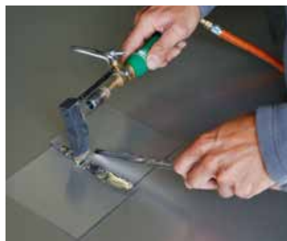
Wiederholen bis die Lötnaht fertiggestellt ist.