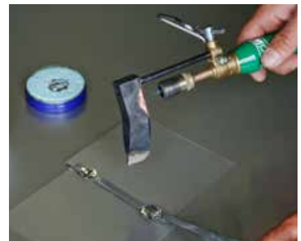
Das Lot anpressen bis die Verbindung hält und das Zinn ausgekühlt ist. Zur schnelleren Abkühlung den LötKolben anheben.