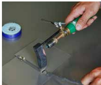
Zinn auf Heftpunkt übertragen und Naht zusammenpressen.