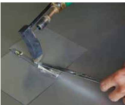
Lot schmelzen, auf Nahtstelle übertragen und mit flüssiger Bewegung eine Naht ziehen.

Zum Ziehen der Lötnaht wird mit geschmolzenem Zinn eine unterbrechungsfreie Naht gezogen die die beiden Werkstücke wasserdicht miteinander verbindet. Unbedingt überprüfen, ob das Lötzinn den Lötspalt voll ausgefüllt hat.