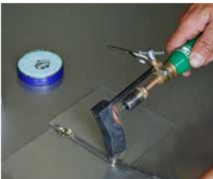
Zinn auf Kupferstück schmelzen.

Bei Lötstellen, wo Spannungen herrschen, werden die zu lötenden Teile mit einander vernietet. Da übernimmt dann die Niete die Aufgabe des Heftpunktes.