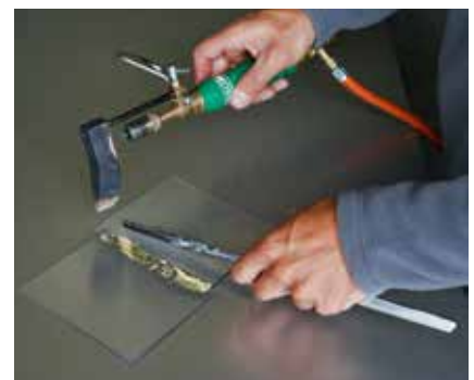
Ob die Naht abgekühlt ist erkennen sie an der angelaufenen Oberfläche.